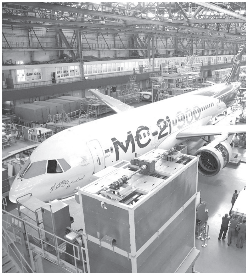
Начало серийного производства МС-21, более трети комплектующих которого создается в Ульяновске, должно стартовать до конца года. Объем твердых (авансированных) заказов на ВС уже превысил 200 единиц.

Как отметил генеральный директор Ассоциации кластеров и технопарков России Андрей Шпиленко, «сегодня Ульяновская область обладает высоким потенциалом развития промышленных кластеров. Однако наличие уже существующих кооперационных связей не всегда дает возможность промышленным предприятиям получать меры государственной поддержки. Благодаря инициативе губернатора предприятия смогут рассчитывать на дополнительную